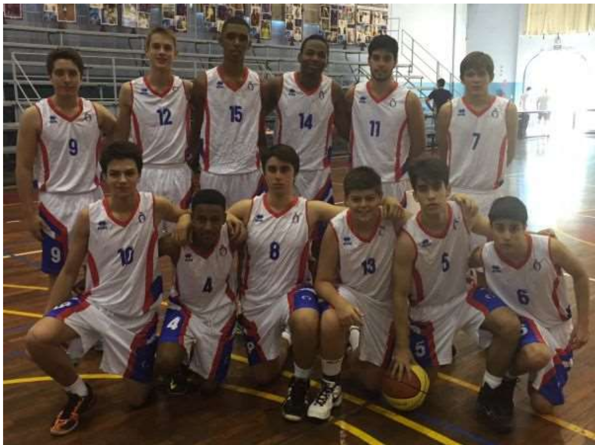
Com equipe Sub 17 da Hípica em 2015