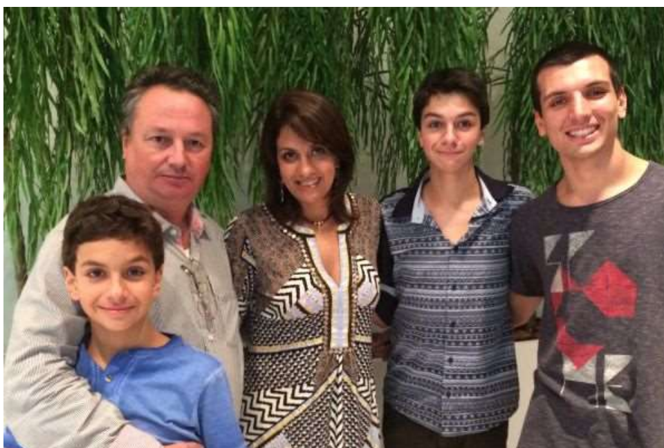
Com a família